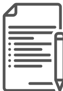
TERMO DE COMPROMISSO