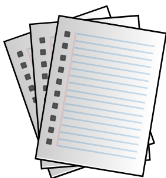
FICHA DE PRATELEIRA